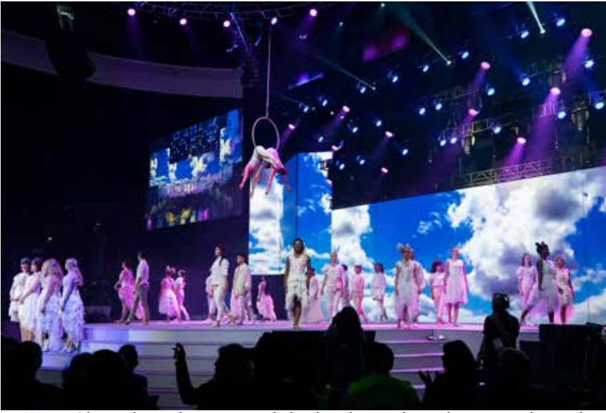
24 Haziran'da yapılan açılış oturumunda katılımcılar çeşitli grupların gösterilerini izleme fırsatı yakaladılar.