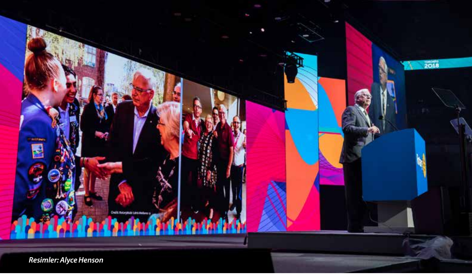
Resimler: Alyce Henson