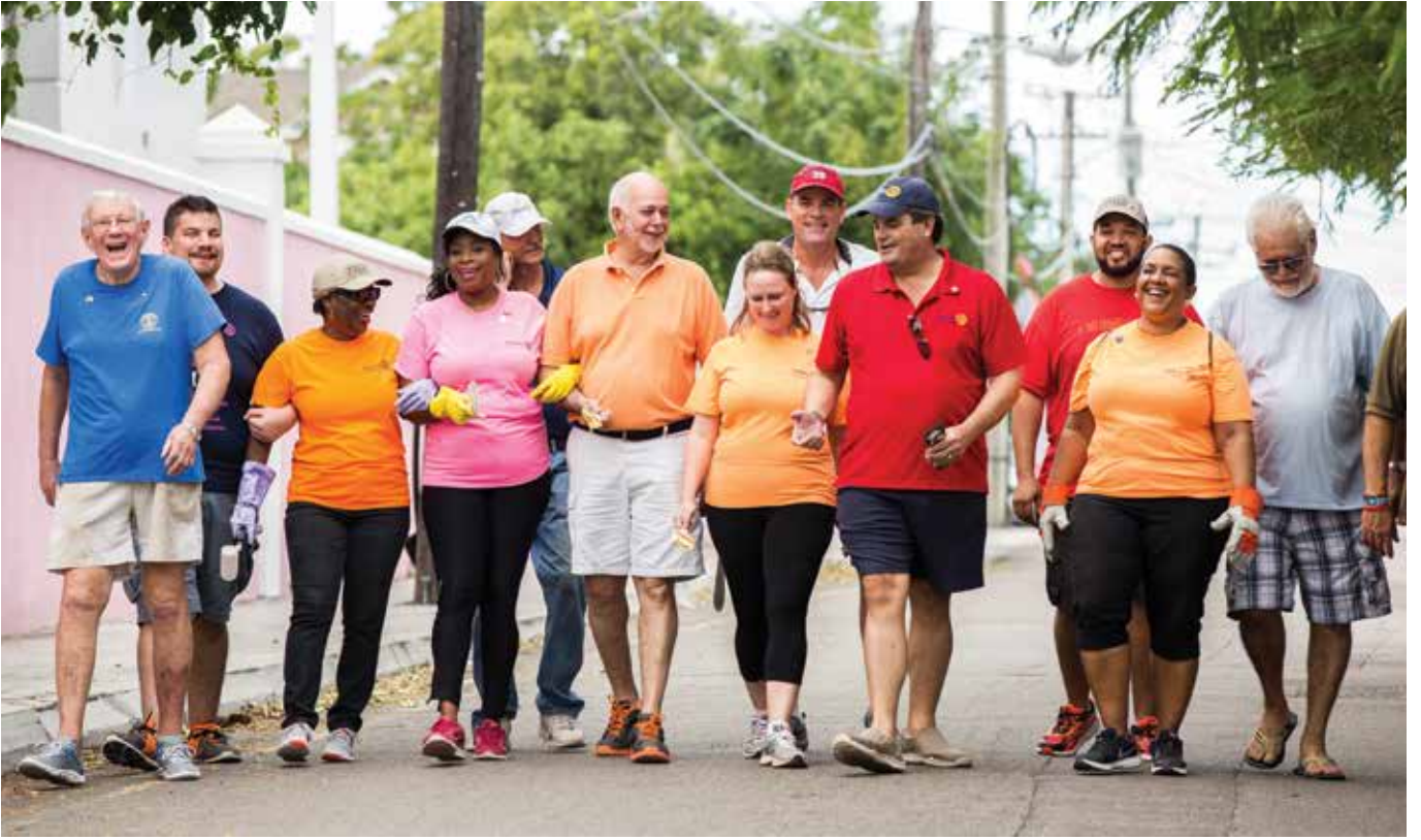
Rotaryenler ve Rotaraktörler Nassau'da Bahama AIDS vakfının bulunduğu toplum merkezinde temizlik yapıyorlar. East Nassau Rotary kulübü bu projenin organizatörü idi. 16 Aralık 2017.

Bu onlar için Rotary'nin bir parçası olma hislerini güçlendirecekti ve ben de bunu yapabilecek bir pozisyonda idim ve aday oldum."