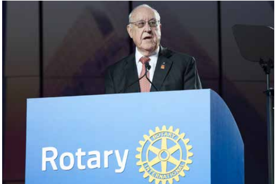
2016-17 UR Başkanı John F. Germ 11 Haziran'da, Uluslararası Rotary Konvansiyonunun açılış konuşmasını yaparken

2017 Konvansiyonu açılış seremonisi Pazar günü Georgia Dünya Kongre Merkezinde yapıldı ve açılış "100. Yıl Çanı"nın çalınması ile başladı. Bu özel çan Rotary Vakfının 100. yılı için İtalya'nın Agnone şehrindeki 1,000 yıllık dökümhanede Marinelli Kardeşler tarafından özel olarak tasarlandı. Çanı'nın sunumu ve çalınması ile beş gün süren, kitap imzalanması, fotoğraf sergisi ve müthiş