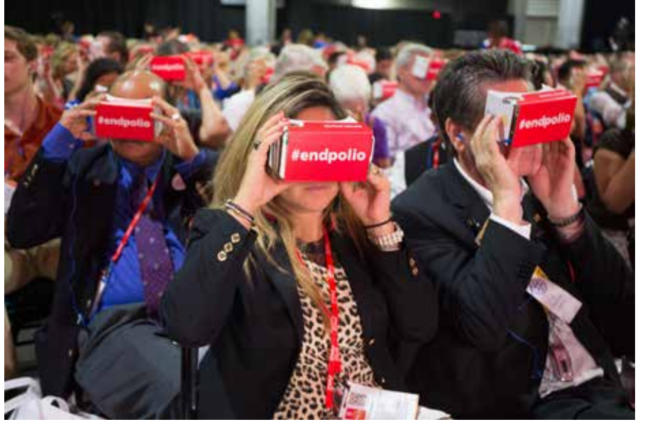
Konvansiyonda Sanal Gerçek aktivitesi de yaşandı. Katılımcılar kendilerine verilen kutularda, telefonlarına indirdikleri bir uygulama ile olayların içine daldılar.

Bu cümle ile başlayan konuşması ile Banerjee katılımcıların alkışlarını alırken, "Mutlu Yıllar" dileyerek Vakfın 100 yıllık hikayesinden anılardan bahsetti. 1917 yılında Avrupa'da savaş devam ederken aslında para talep etmenin hiç de doğru zamanı olmadığını belirten Banerjee, daha sonra dünya ekonomik krizi, ikinci dünya savaşının ayak sesleri ışığında Rotaryenlerin Arch C. Klumph'ın bu girişim için hevesli olmamalarının normal bir davranış olduğunu söyledi. "Ancak Arch C. Klumph inatçı bir adamdı ve hiç umudunu kaybetmedi