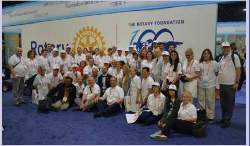
Türk Rotaryenler yaklaşık 100 kişilik bir grup olarak Atlanta'da yapılan Uluslararası Rotary'nin Konvansiyonuna katıldılar.

Banerjee son olarak da Rotary Vakfının 100. yılında hedef olarak konulmuş bulunan 300 milyon dolar fon konusuna değindi: “Bu rakamı yakalama yönünde önemli adımlar atı-