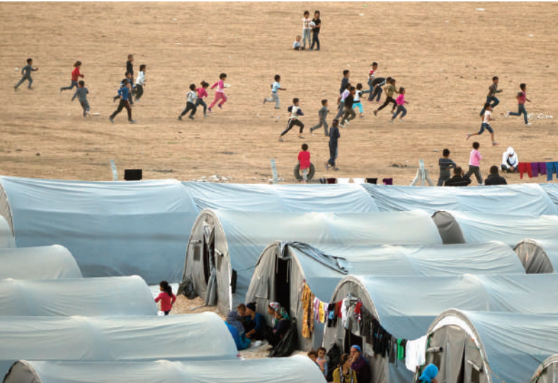
Türkiye son yıllarda dünyadaki en büyük mülteci nüfusuna ev sahipliği yapıyor.