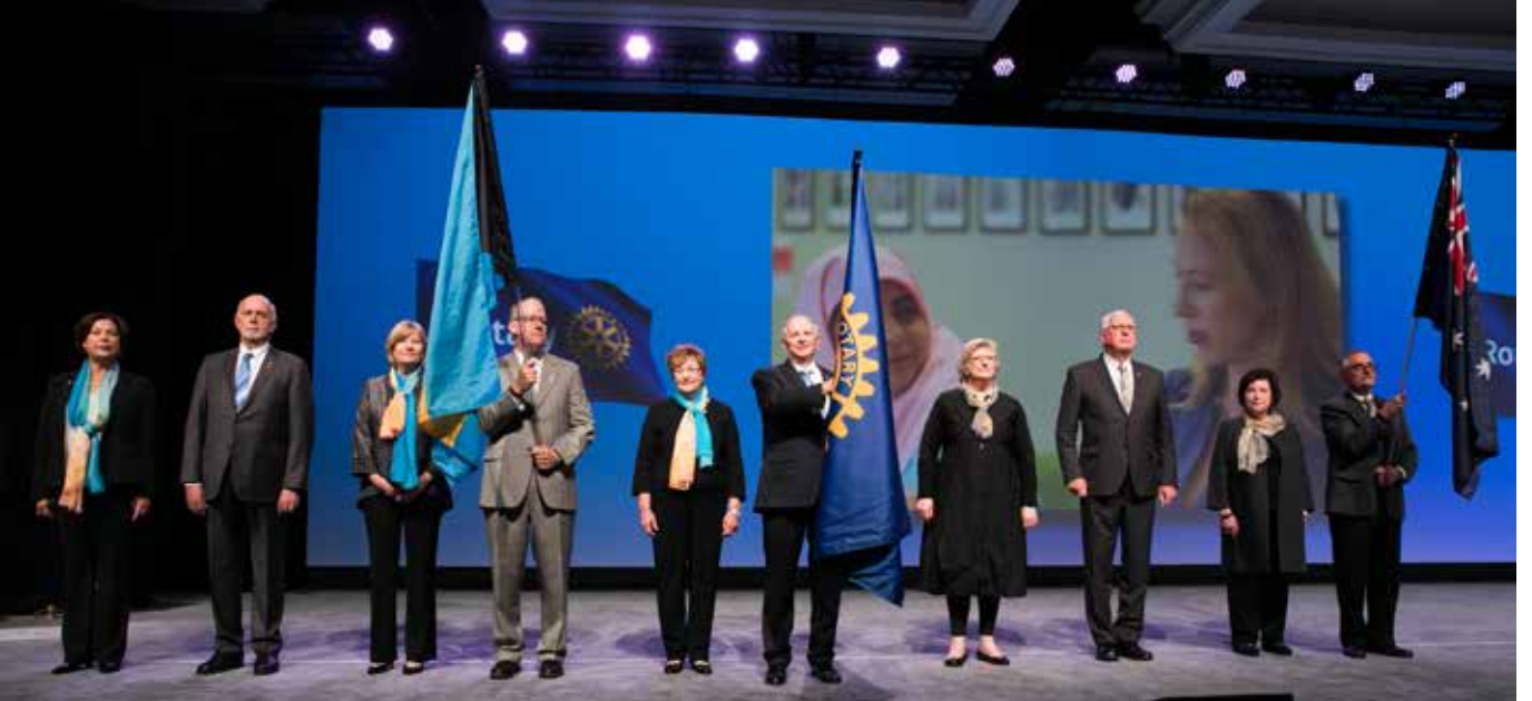
Asamblenin 2. oturumunda bayrak geçişinden önce, başkanların ülkeleri Bahama, Yeni Zelanda ve Rotary bayrakları