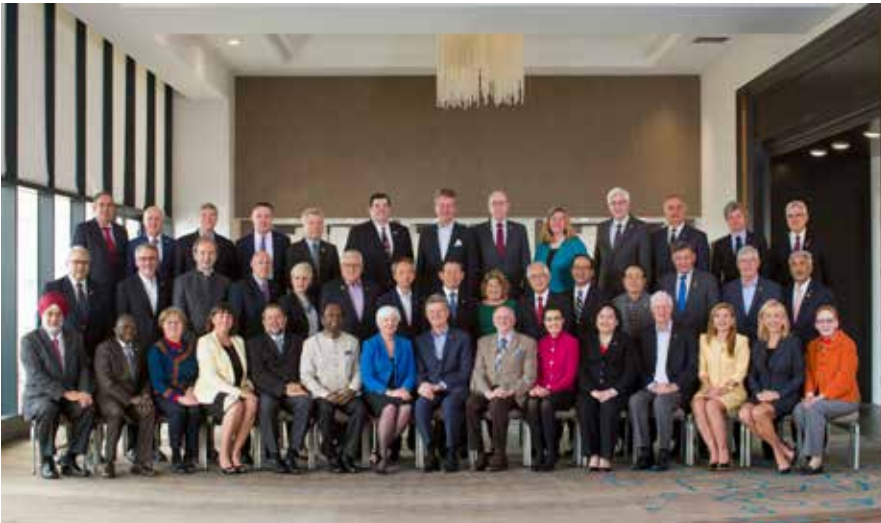
Asamblede görev alan Rotary Eğitim Liderleri birarada

Rassin, tüm liderlerin Rotary hizmetine geniş bir küresel sistemin parçası olarak bakmaları gerektiğini söyledi. Bu nedenle de gelecek dönem guvernörlerinin sadece kulüplere değil, toplumlarına da ilham kaynağı olmaları gerektiğini vurguladı. "Yaptığımız iyi şeylerin kalıcı olmalarını istiyoruz. Dünyamızı daha yaşanabilir bir yer haline getirmek istiyoruz. Sadece burada ve sadece bizim için değil,