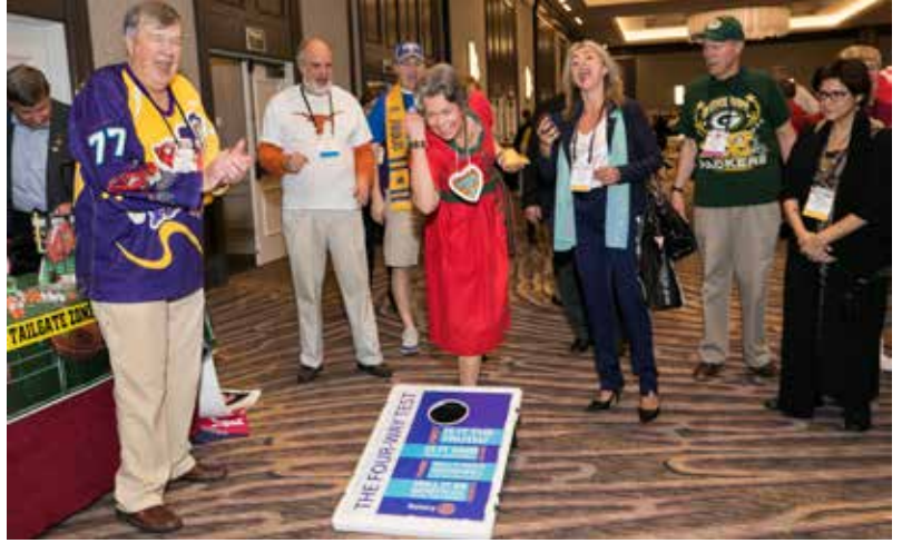
Rotary toplantıları aynı zamanda dostluk ve eğlencenin doruk noktasına ulaştığı organizasyonlardır. Yukarıda buna örnek güzel bir resim görülmüyor