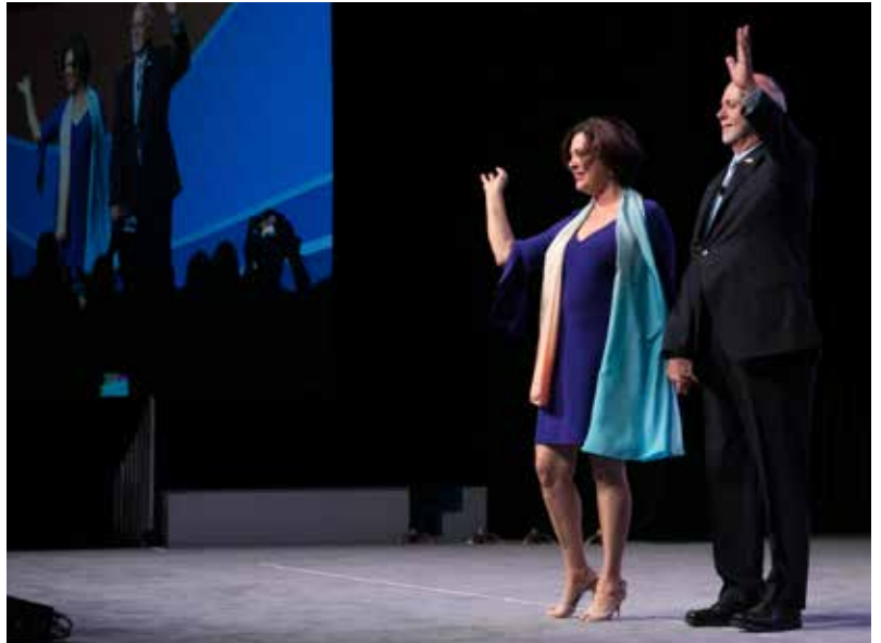
2018-19 UR başkanı Barry Rassin ve eşi asamble sonunda katılımcıları selamlıyor