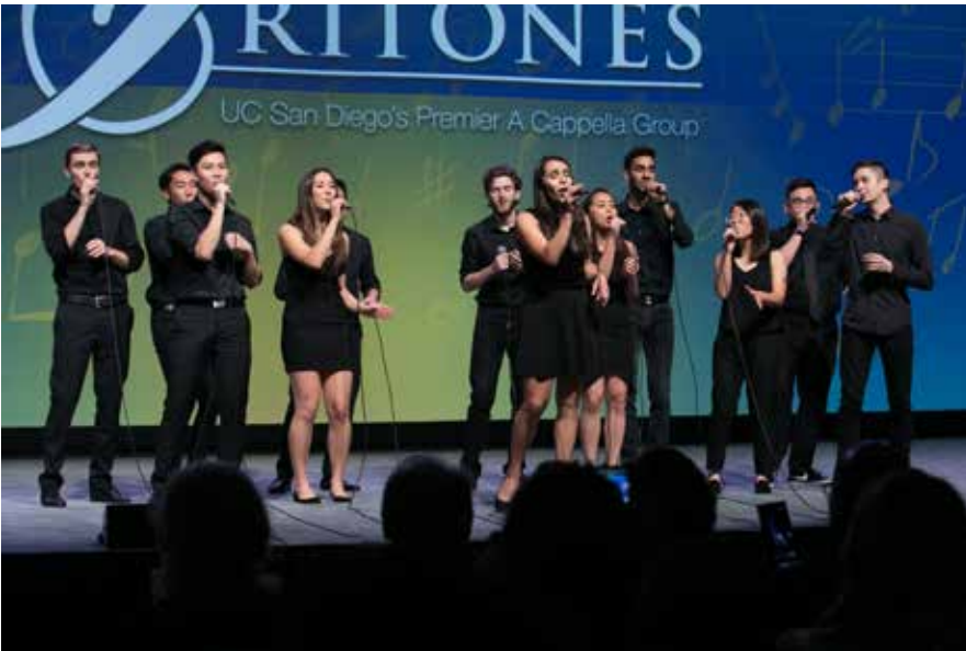
Asamblede son gün genel oturumda San Diego Üniversitesi müzik grubu Tritones performansı ile katılımcıları büyüledi

"Daha önce de belirttiğim gibi Rotary bir kavşakta bulunmaktadır. Bu kavşaktan başarıyla geçebilmemiz için sizlere Paul Harris'in sözlerini hatırlatmak isterim: 'Rotary doğru kaderini oluşturacaksa her zaman evrimci olmalı, arada sırada da devrimci olmayı denemelidir'. Bu nedenle bugün 21. yüzyılın meydan okumalarına 20. yüzyılın çözümleriyle cevap verme tuzağına