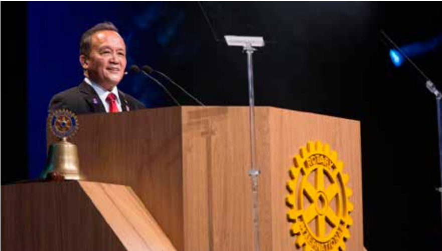
Uluslararası Rotary 2014-15 dönem başkanı Gary C.K. Huang, Brezilya'nın São Paulo şehrinde yapılan konferansın açılış konuşmasını yaparken görülüyor

U luslararası Rotary'nin 106. Konvansiyonu 6-9 Haziran tarihleri ara-