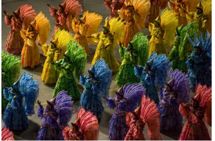
Konvansiyon'da "Phoenix Ateş Dansçıları" yukarıdaki resimlerde görüldüğü gibi izleyicileri etkileyen gösteriler yaptılar.

lemesi ile ilgili olarak büyük bir fırsat olarak görülmesi gerektiğine değindi: "Şu anda Çin'de üyelik sadece yabancılara tanınmış bir ayrıcalık ve o ülkedeki 300 Rotaryen 23 değişik ülkeden gelmiş insanlar. Rotary Pekin ve Şangay'dan sonra diğer şehirlerde de gelişmeye başladı. Yönetim Kurulumuz 10 yeni kulübe daha beratlarının verilmesini onayladı. Bu genişlemenin Çin'deki yolumuzu açacağına inanıyorum."