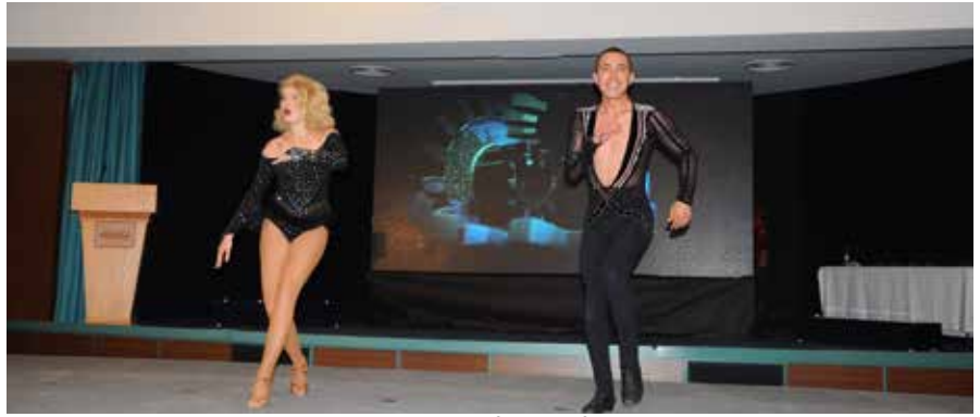
Latin dansları gösterisi ile başlayan konferans Efes Rotary Kulübü başkanı açılış konuşması ile devam etti