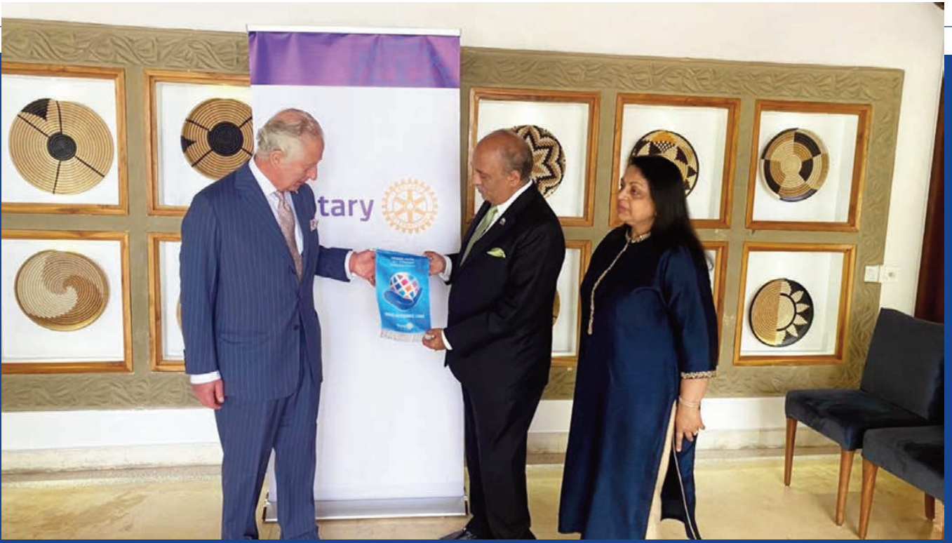
2021-22 Uluslararası Rotary Başkanı Shekhar Mehta da geçen yıl Ruanda'nın Kigali kentindeki Commonwealth Hükümet Başkanları Toplantısı sırasında Rotary Onur Ödülünü takdim etti.