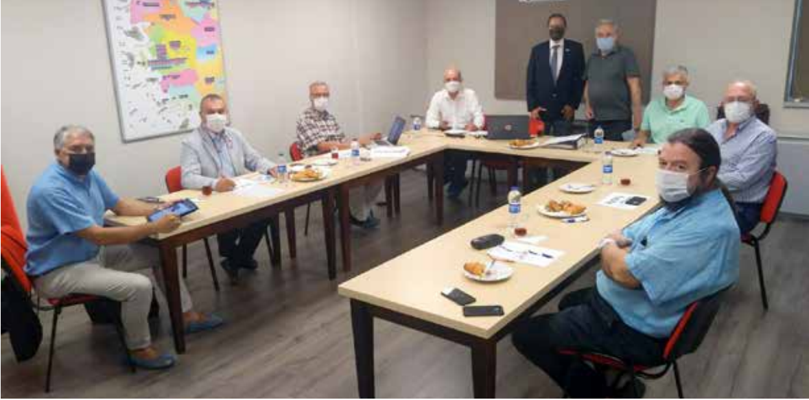
Rotary Yayın ve İletişim A.Ş. nin Mart ayında ertelenen Genel Kurulu pandemi koşullarına riayet ederek 17 Eylül'de yapıldı ve yeni yönetim kurulu seçildi

1 988 yılında yayın hayatına başlayan ve 2001 yılında alınan şirketleşme kararı ile Geçmiş Dönem Governörleri tarafından kurulan Rotary Yayın ve İletişim Hizmetleri A.Ş., ülkemizdeki 3 Rotary Bölgesinin ortak dergisi olarak yayını devam ettirmekte.