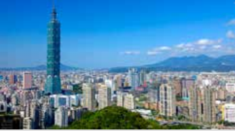
Taipei, Taiwan, 12 - 16 Haziran 2021