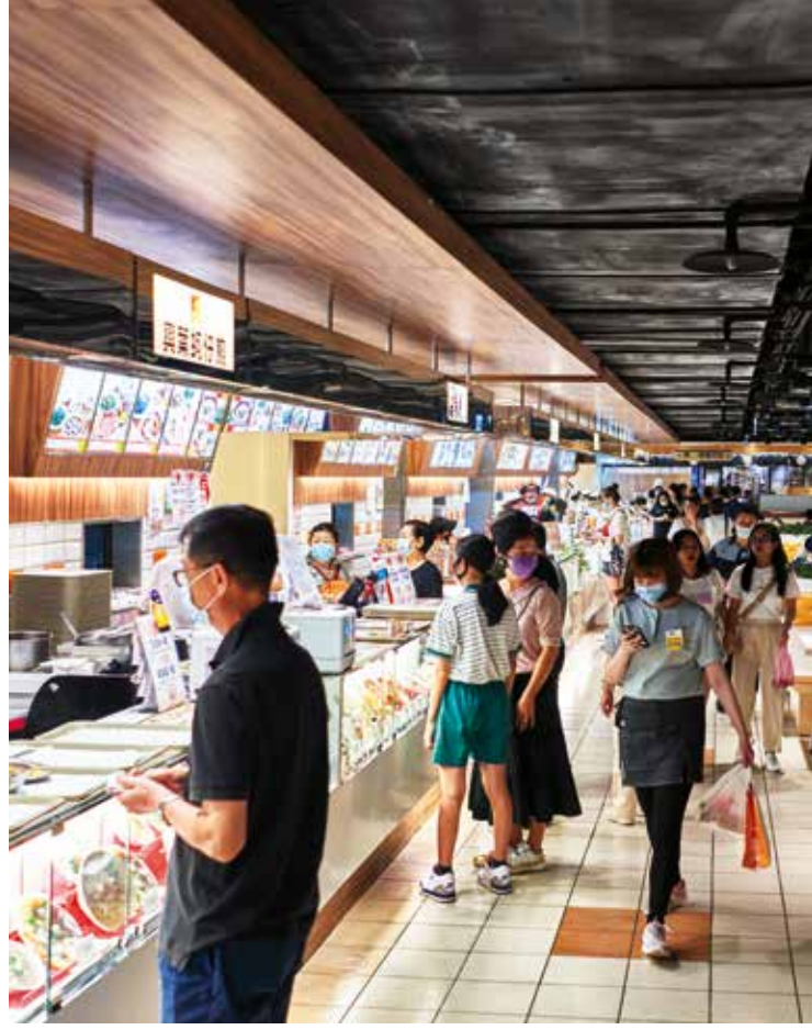
Taipei'de yaşam adeta yemek etrafında döner, tavada kahvaltı için kızartılmış ekmeklerden (altta) alışveriş merkezlerinin yemek katlarına kadar (üstte).