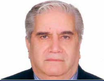
GDG AKIN GÖKYAY UR 2430. BÖLGE