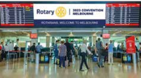
Melbourne Avustralya, 27-31 Mayıs 2023