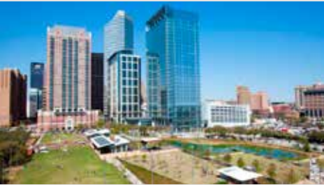
Houston ABD, 4-8 Haziran 2022