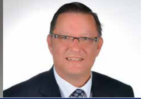
GDG GÜNEŞ ERTAŞ UR 2440. BÖLGE