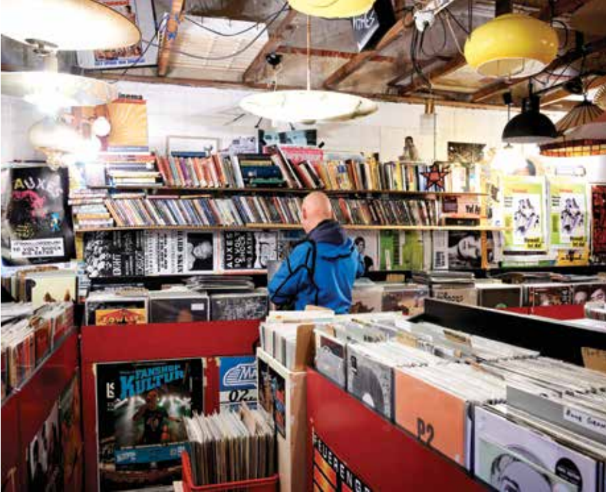
Hamburg, St. Pauli'de bir plakçı dükkanı. Bu bölgede plak ve kitap yaygın. Dükkanlar bir anlamda Hamburg'luların zevkini yansıtıyor.