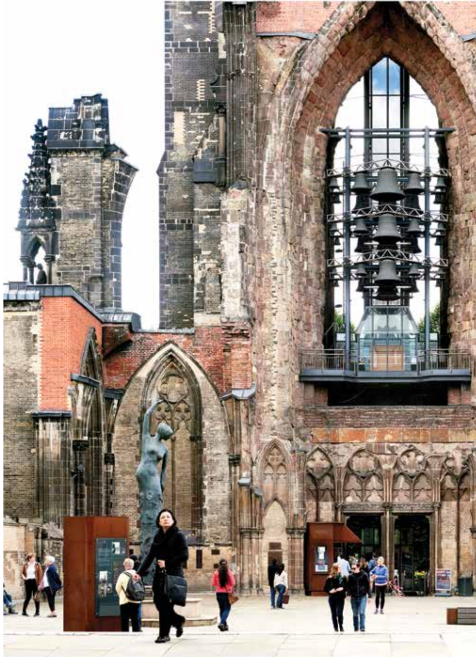
Hamburg'un, St. Nicholas kilisesi bir savaş anıtı olarak II. Dünya Savaşında bombalanmadan sonraki durumunda bırakılmış. Kilisenin mahzeninde Hamburg'un bombalanması ile ilgili resimlerin bulunduğu bir müze yer alıyor.

göl ile ilginç bir şehir Hamburg. Dünyanın her tarafından malların geldiği bir "Marktplatz" kelimesine uygun olarak, alışveriş sınırsız ve yanında eğlence de eksik değil. Cumartesi akşamları bir zamanların 'kırmızı fener sokağı' olarak bilinen ve 1960'larda Beatles'ın ünlendiği mekanın bulunduğu Reeperbahn, her yaştan insanın bulunduğu bir yer olarak dikkat çekiyor. Yelkenlerini açmış bir gemi gibi Elbe nehrine doğru