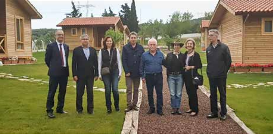
İzmir Büyükşehir Belediyesi ve Yaşar Üniversitesi yetkilileri

sonunda, bütün üyeler, “ haydi bize gel ” dediler. O günden bu yana, onur duyduğum bir kulübün üyesi oluvermişim.