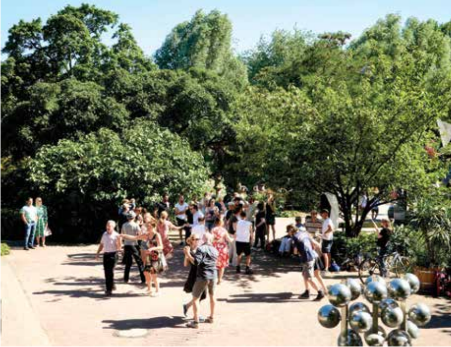
Hamburg, St. Pauli, Planten und Blomen Park, Hamburg'lular ve turistlerin uğrak yerlerinden biri. Park alanlarında gezinirken her türlü aktiviteye rastlamak mümkün. Dans eden çiftler buna bir örnek teşkil ediyor.

alıyor ve Europa Passage olarak adlandırılan mekanda 100'den fazla dükkan ve restoran bulunuyor. Bunlar sadece Hamburg'un sunduğu güzelliklerden bazıları.