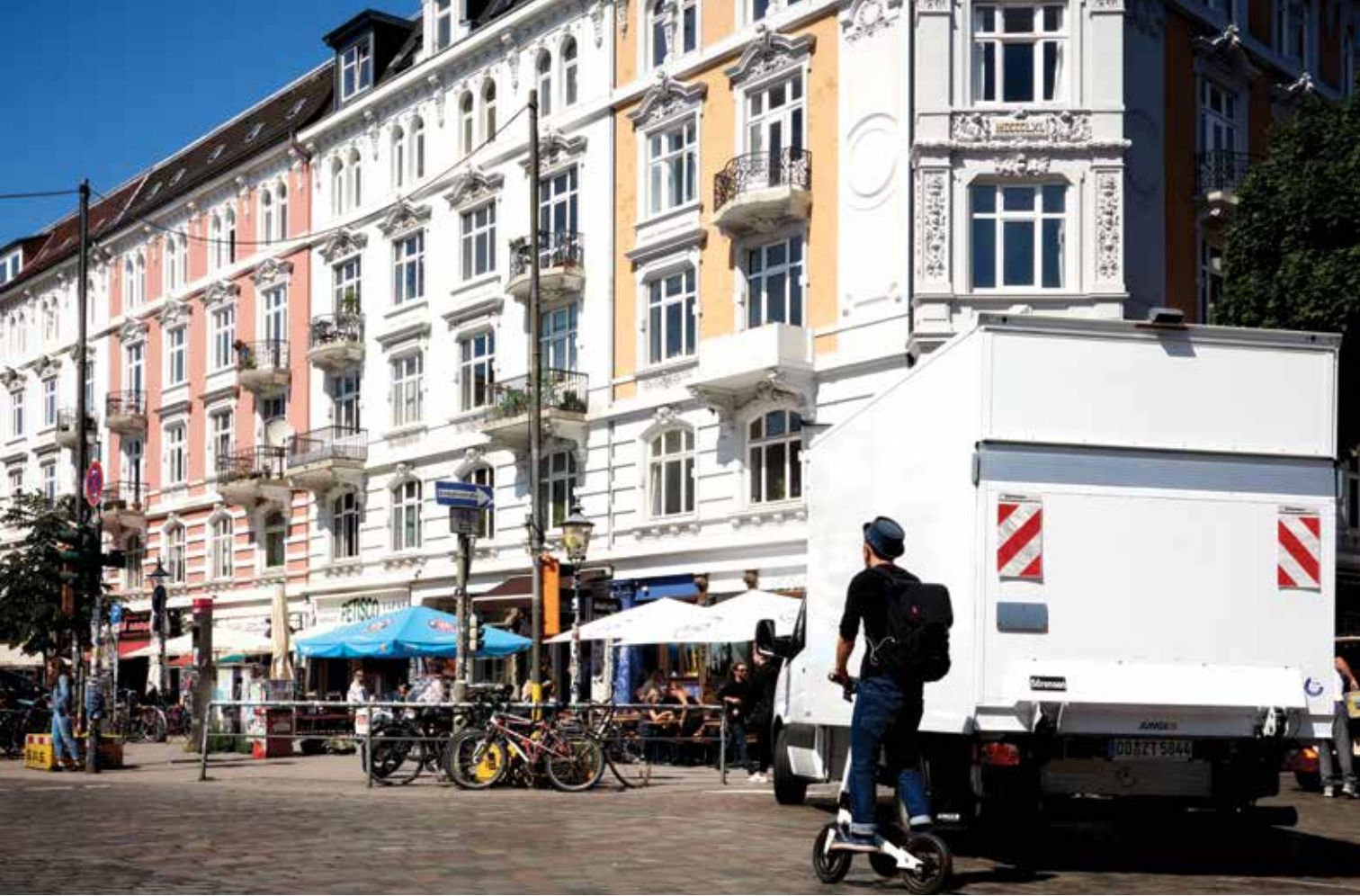
Hamburg, Schanzenviertel, Schulterblatt'da kaldırım kafeleri ve restoranlar iyi zaman geçirilebilecek mekanlar

yaşadıklarımı değil, ama bombalayan uçakların mürettebatının yaşadıklarını da gözlemleyebiliyorsunuz.