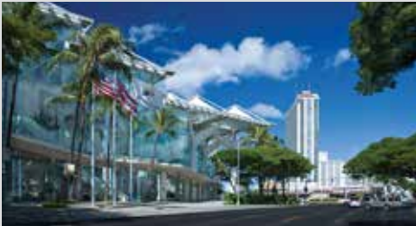
Honolulu, Hawai, ABD, 7-10 Haziran 2020