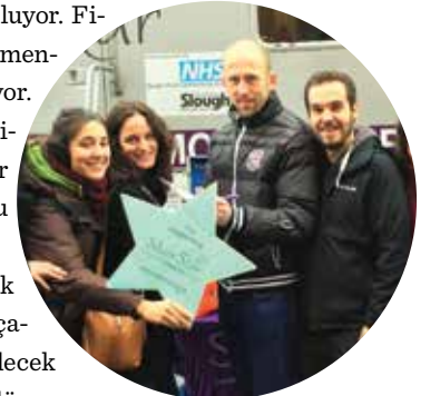
Üyelerin bir kısmı Diabet testi projesinde Silver Star kurumuna destek verirken

Eğlence kulübünün tasarımının bir parçası olarak düşünülmüş. Hunter büyümelerinin esnekliği sağlamaları sayesinde olduğunu söylüyor ve herkese şu mesajı veriyor: "Değişimden korkmayın ya da vazgeçmeyin. Rotary biz ne istersek o olabilir.