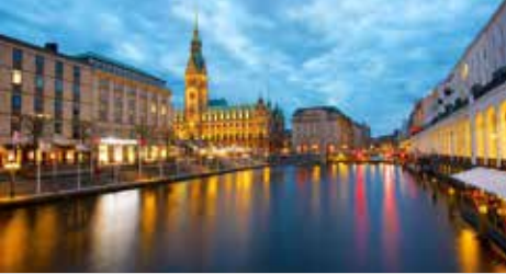
Hamburg Almanya, 2019