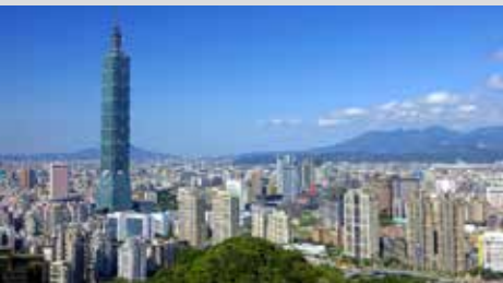
2021 - Taipei