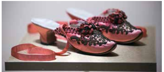
Bata Ayakkabı Müzesindeki ilginç terliklerden biri

Kendi kimliğini, kültürlerin eridiği bir kazan olarak tanımlayan bu şehir yüzde yüz Kanadalı. Ama Toronto'nun gerçek stili ile, her şey serbest.