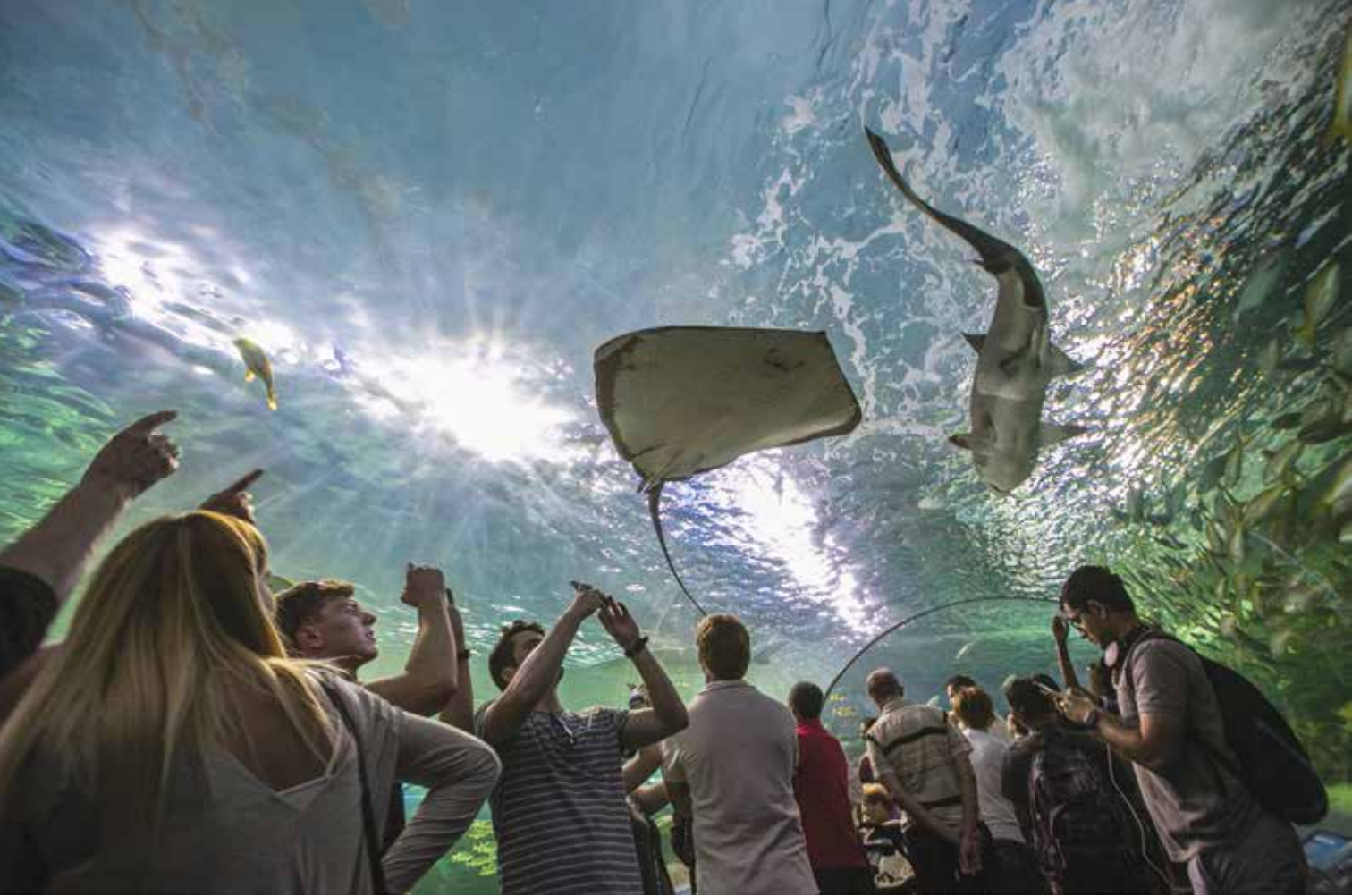
Toronto'daki Ripley Akvaryumu, oldukça ilginç deniz canlılarının izlenebileceği bir mekan. Arzu ettiğiniz takdirde dalgıç elbisesi giyip vatozları beslemeniz de mümkün

nün. Ürkütücü? Heyecan verici? her iki halde de kasketinizdeki GoPro kamera bu tecrübenizi kaydediyor ve istediğiniz zaman tekrar seyretme fırsatı veriyor.