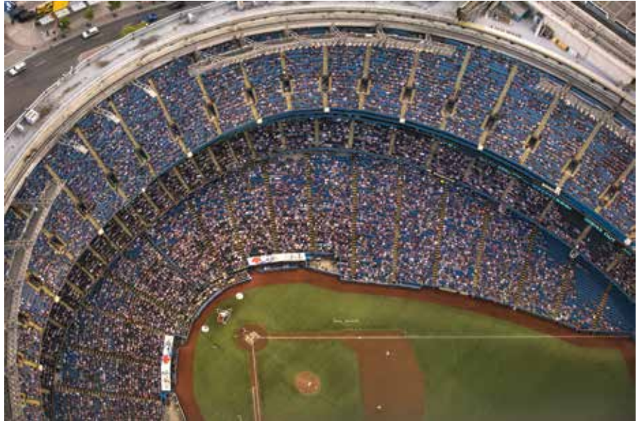
Toronto'nun Blue Ray takımının beyzbol sahasını, CN Kulesinden izlemek mümkün. 50.000 kişilik stadyum açılıp kapanabilen bir çatıya sahip

Toronto'nun Blue Ray takımının beyzbol sahası bulunuyor. 50.000 kişilik olan stadyum, açılıp kapanabilen çatısı ile biliniyor. Bu mekanda maçlardan başka konserler ve başka faaliyetler de gerçekleşiyor.