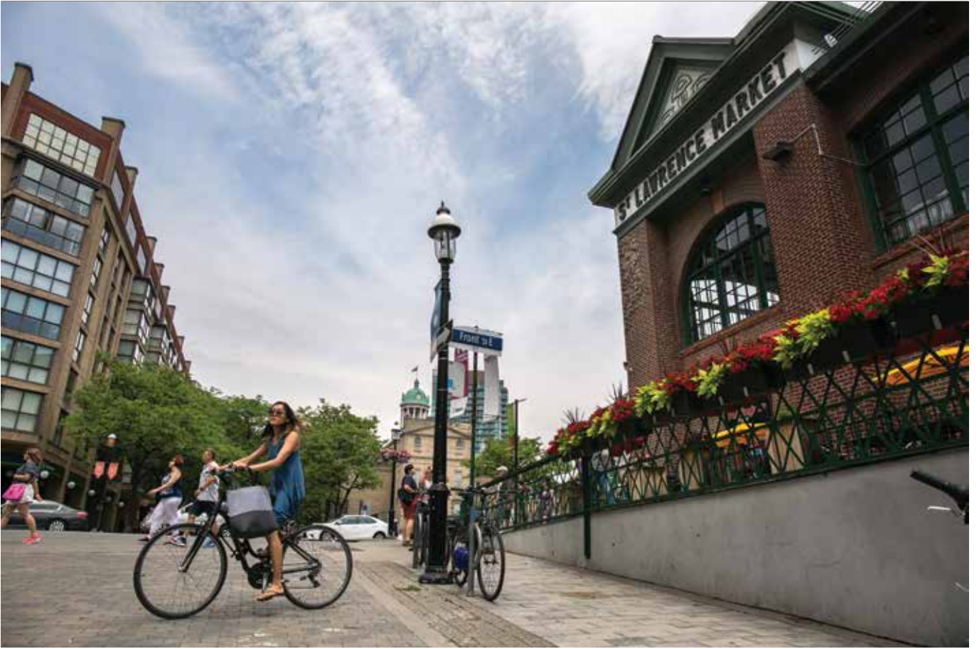
St Lawrence Market National Geographic dergisi tarafından dünyada en iyi gıda maddelerinin satıldığı 10 çarşı arasında yer alıyor. Buradaki standlarda karnınızı doyurabilir, her türlü gıdayı bulabilirsiniz. Yan sayfada Kensington Market mahallesinde sıkça rastlanan sanatçılardan bir tanesi gözüküyor.

Toronto'ya yukarıdan bakan bahçelerinde Rotaryenler için bir konser planlıyor.