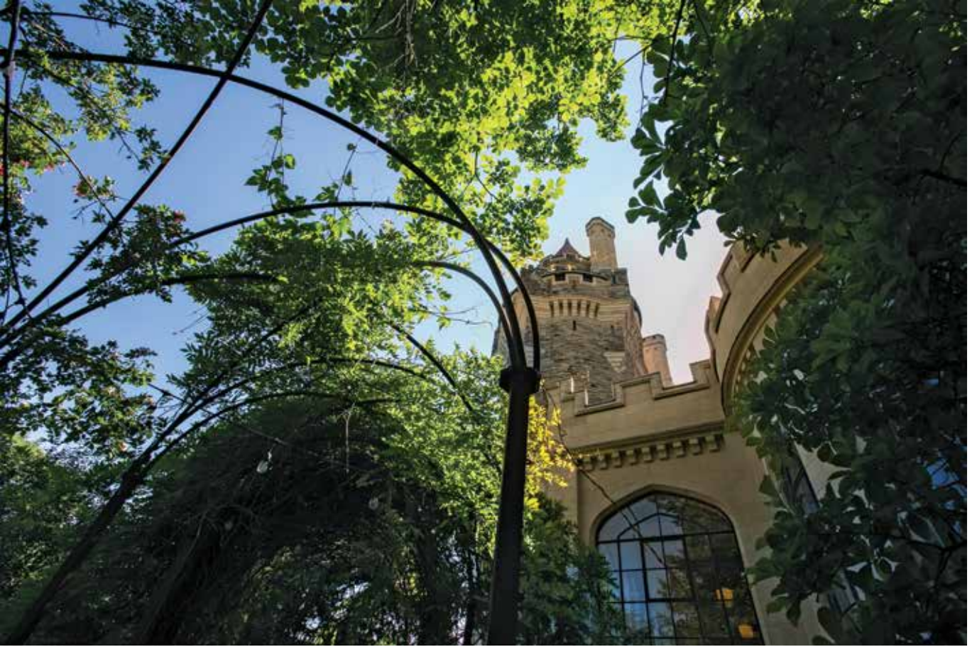
Kuzey Amerika'daki en büyük kale olan Casa Loma, şehre hakim tepeden bahçeleriyle ziyaretçileri cezbediyor. Ağırlama komitesi kalenin bahçesinde konvansiyona katılacaklar için bir konser düzenlemeyi planlıyor.