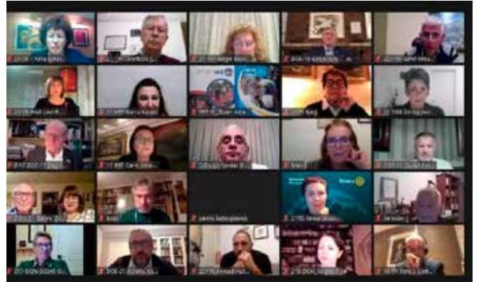
Zone 21 Enstitüsü öncesi Gubernör Eğitim Sanal Seminerine katılan gelecek dönem guvernörlerinden bazıları